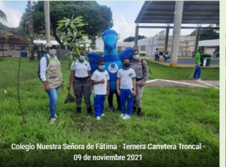
Colegio Nuestra Señora de Fátima · Termera Carretera Troncal · 09 de noviembre 2021