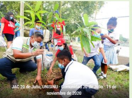
JAC 20 de Julio, UNISINU · Comunidad 20 de Julio · 19 de noviembre de 2020