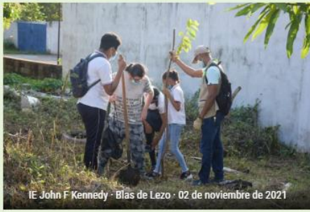
IE John F Kennedy · Blas de Lezo · 02 de noviembre de 2021