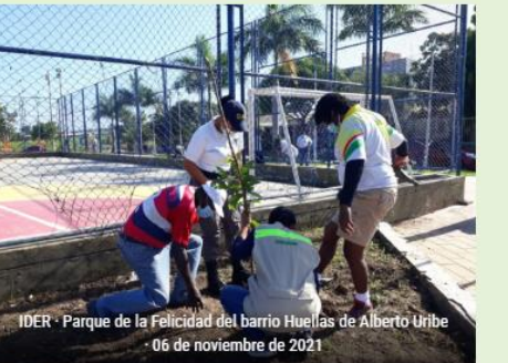
IDER · Parque de la Felicidad del barrio Huellas de Alberto Uribe · 06 de noviembre de 2021