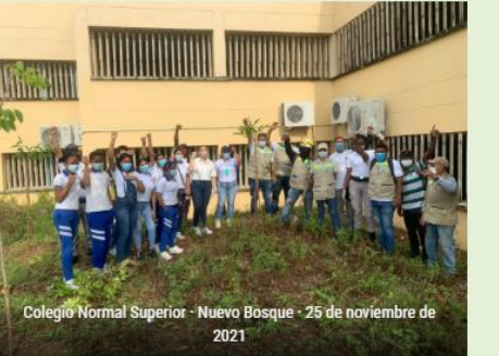
Colegio Normal Superior · Nuevo Bosque · 25 de noviembre de 2021