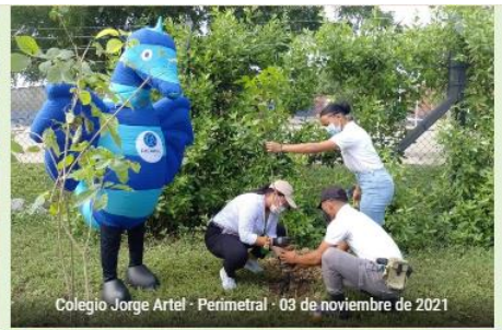
Colegio Jorge Arteel · Perimetral · 03 de noviembre de 2021