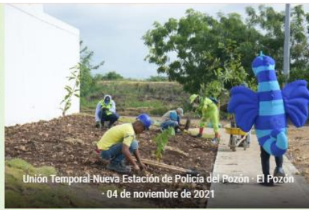
Unión Temporal-Nueva Estación de Policía del Pozón · El Pozón · 04 de noviembre de 2021