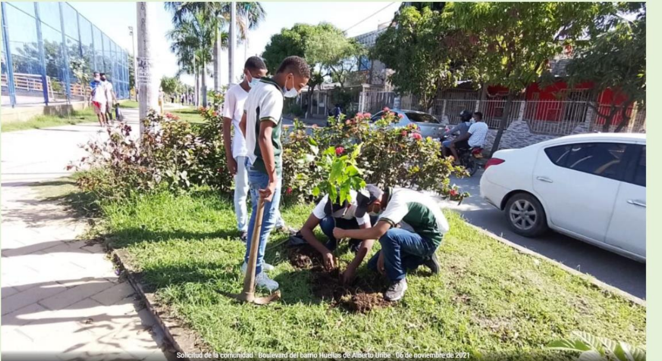
Solicitud de la comunidad · Boulevard del barrio Huellas de Alberto Uribe · 06 de noviembre de 2021