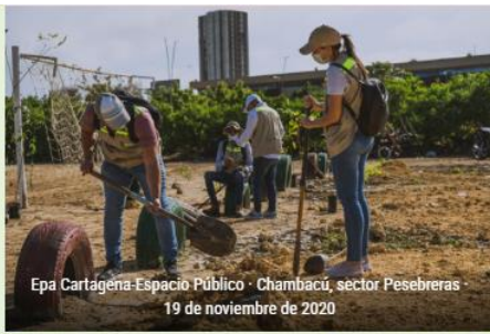
Epa Cartagena-Espacio Público · Chambacú, sector Pesebreras · 19 de noviembre de 2020