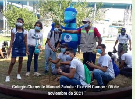
Colegio Clemente Manuel Zabala · Flor del Campo · 05 de noviembre de 2021