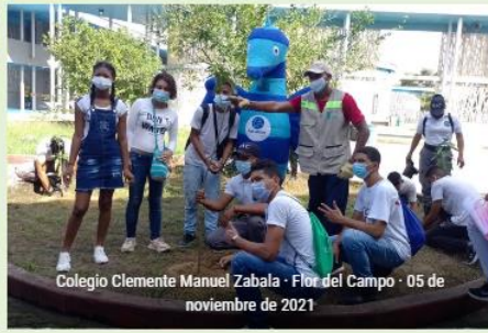
Colegio Clemente Manuel Zabala · Flor del Campo · 05 de noviembre de 2021