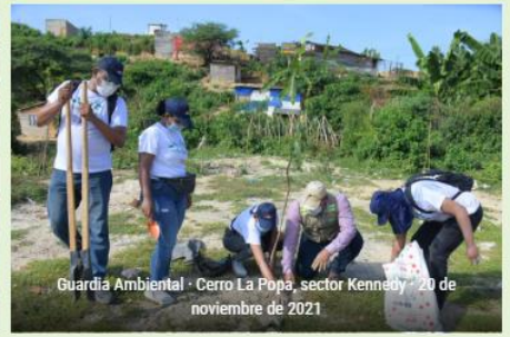
Guardia Ambiental · Cerro La Popa, sector Kennedy · 20 de noviembre de 2021