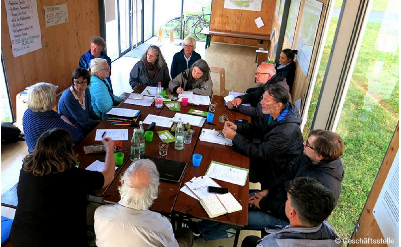
Öffentliche Sitzung der Feldkoordination im Info-Pavillon