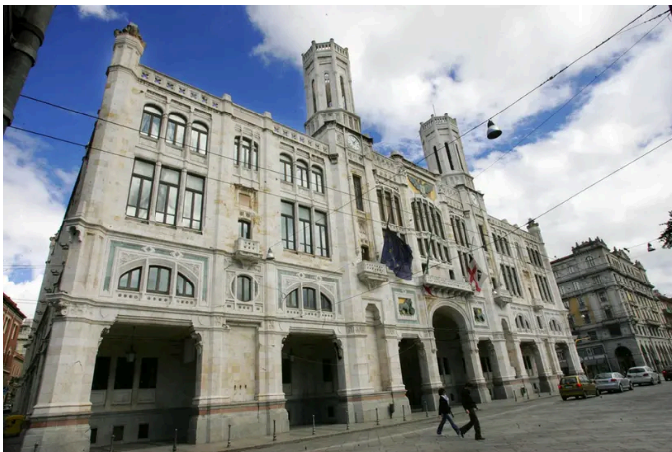
Il Municipio di Cagliari

Il progetto, che riguarda 52 siti comunali, prevede interventi per 3 milioni di euro