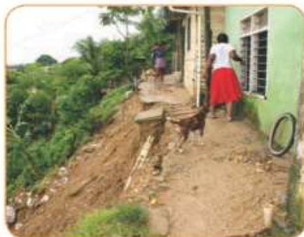
De izquierda a derecha: Cerro de La Popa sector Narño.