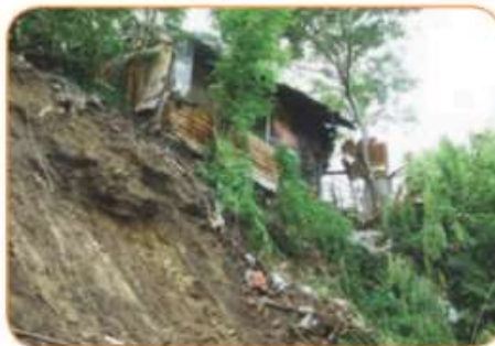
De izquierda a derecha: Diferentes vistas del cerro de La Popa.