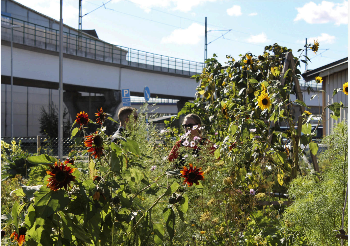
Slaktarens trädgård ligger som en grön oas i asfaltsdjungeln.

- Det är fantastiskt att det kan komma upp så mycket ur lådor som står på asfalt, konstaterar Rebecca Hallqvist.