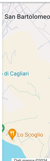
Dati mappa ©2024