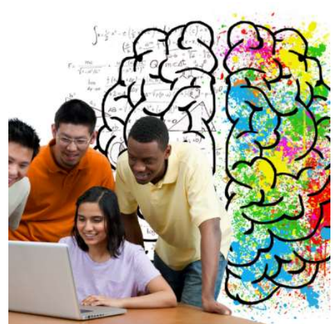
9 perfiles que puedes desempeñar al estudiar Psicología