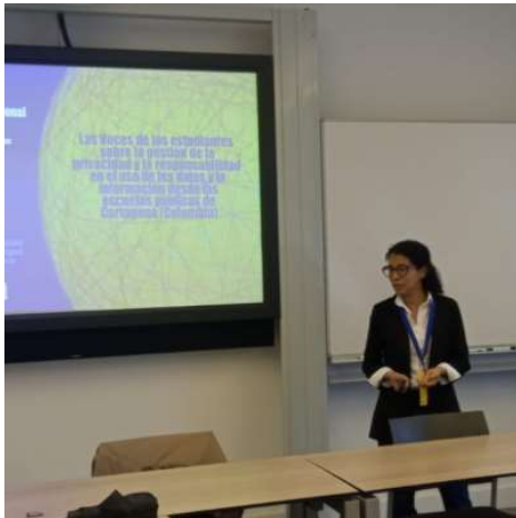
La UTB destaca en el Congreso Internacional sobre Aprendizaje en Países Bajos