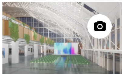
FOTO Cum va arăta Centrul Expozițional Moldova după reabilitare

Donația a fost făcută la mijlocul lunii decembrie 2020, iar Primăria va deveni oficial proprietară asupra clădirii la sfârșitul acestei săptămâni, odată cu aprobarea de către Consiliul Local a unei hotărâri în acest sens.