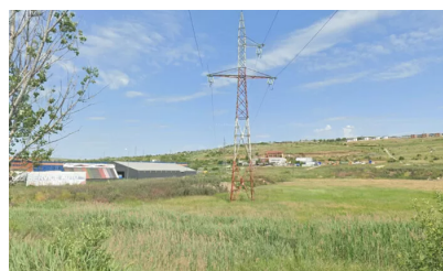
Licitație reluată: teren de 1,6 ha, lângă Dedeman Valea Lupului, scos la