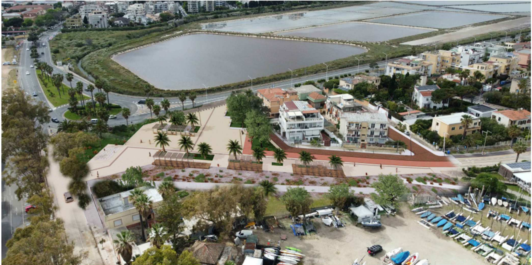
Comune di Cagliari - Servizio Opere strategiche Mobilità Infrastrutture viarie e reti