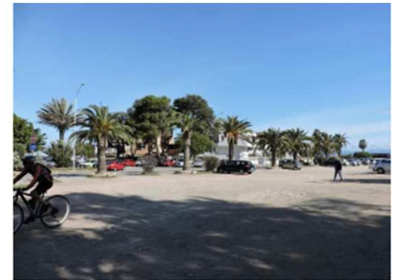
Aree di connessione con il lungomare Poetto e ambiti di risulta irrisolti