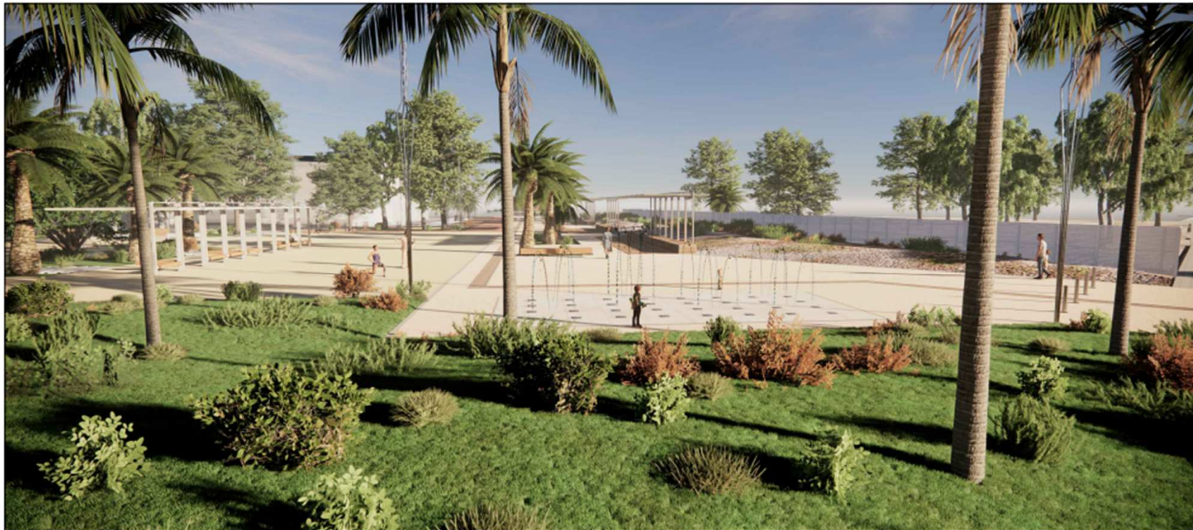
RENDERING DELLA PIAZZA- VISTA DA MARINA PICCOLA VERSO IL LUNGOMARE

Comune di Cagliari - Servizio Opere strategiche Mobilità Infrastrutture viarie e reti