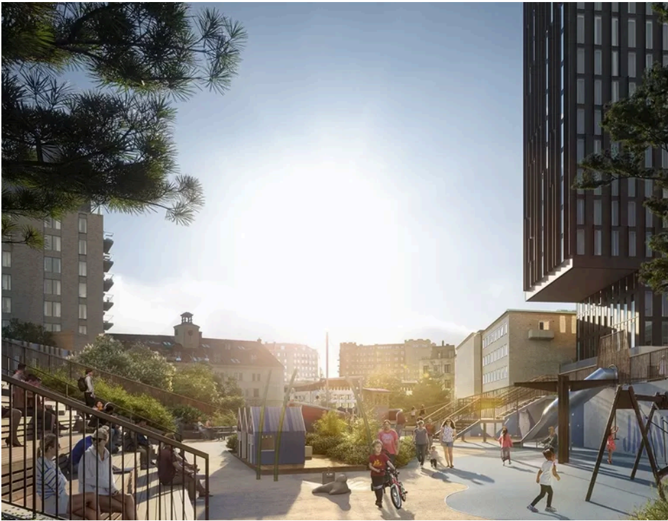
Järnvågsparken. Börjar byggas 2030 och ska vara klar 2031.